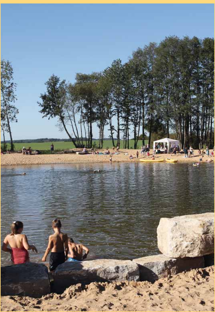
Naturbadensee in Frensdorf

Schulhaus Pettstadt Schulstraße 12 96158 Frensdorf